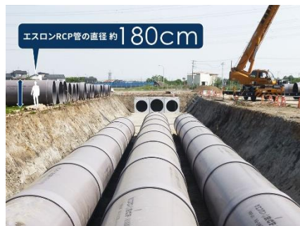
雨水貯留管「エスロンRCP」

さらに、3つの公園に加え、まち全体に地域の在来種を中心とした豊富な植栽を施し、高い緑被率を実現しています。災害に強いインフラ設備に加え、緑地の保水能力も活用し、豪雨の被害の抑制を図っています。