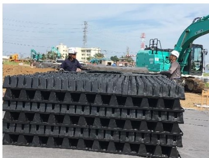
雨水貯留システム「クロスウェーブ」

「あさかりードタウン」では、積水化学グループの製品・サービスなどを幅広く積極的に採用しており、コンセプトに掲げる「Safe&Sound：安心・安全で、環境にやさしく、サステナブルなまち」の実現を図っています。地下にも災害にも強いインフラ設備を採用しています。地下に雨水を一時貯留し、流出を抑制できる「クロスウェーブ」や、過去の大地震でも破損がない高耐震性ポリエチレン管「エスロンRCP」などで、近年多発しているゲリラ豪雨の際にも河川の氾濫や浸水といった水害による被害の低減を図ります。