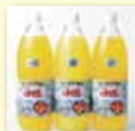
北海道余市ストレート ジュースセットU