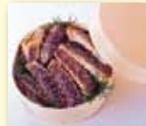
生たらバセイロ蒸し